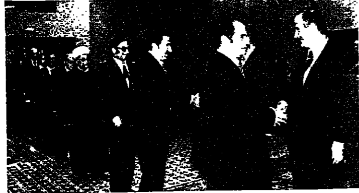
استقبال السفراء في دمشق